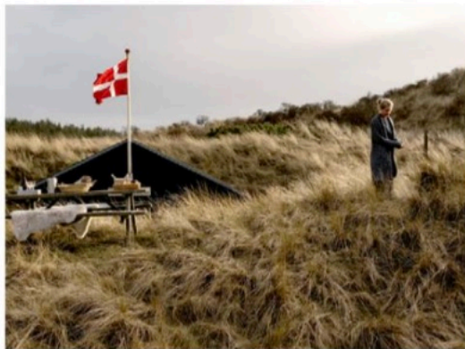
DÄNEMARK – entdecke die Langsamkeit