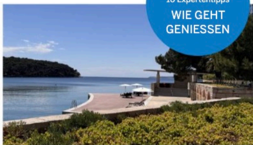
LOSINJ – Wertschätzung für eine Insel in Kroatien